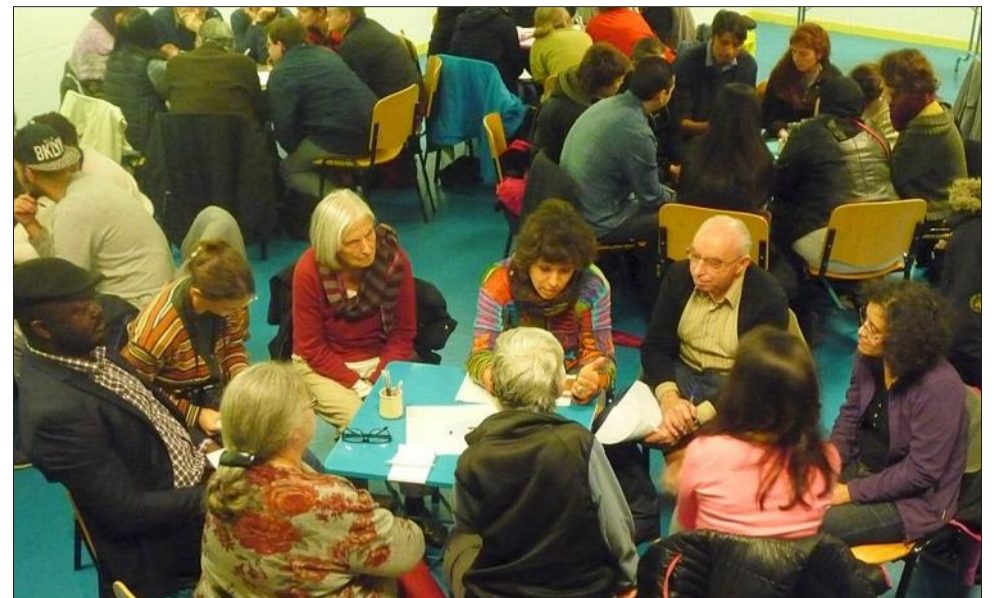
Cent trente personnes ont participé au débat, réparties en groupes de travail.

« L'enfermement n'est pas qu'un sentiment, c'est aussi une réalité », confirmait-il à la suite des témoignages des habitants du quartier. D'après les enquêtes, la mobilité de la population des cités est entravée par le chômage, la précarité, les discriminations, les transports publics insuffi-