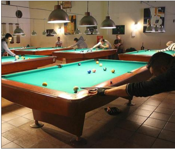
L'Open de Grenoble de billard américain a rassemblé quarante participants hier.

BILLARD | 40 personnes ont participé Première édition de l'Open de Grenoble